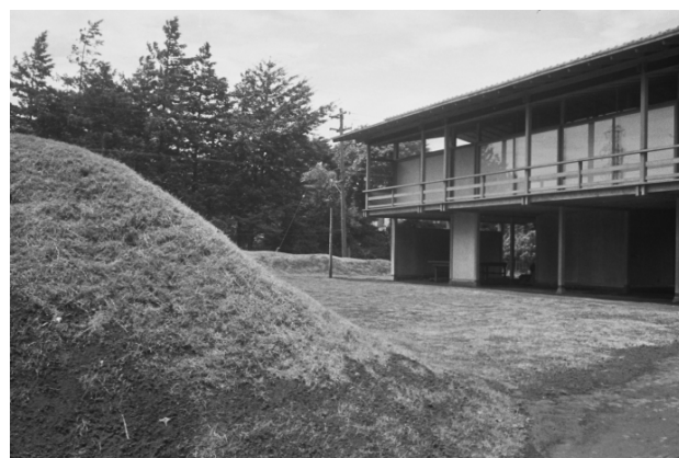
丹下健三 《自邸》 1953年 東京、現存せず 撮影：丹下健三

本展は、いま、日本の建築を読み解く鍵と考えられる9つの特質で章を編成し、機能主義の近代建築では見過ごされながらも、古代から現代までその底流に脈々と潜む遺伝子を考察します。貴重な建築資料や模型から体験型インスタレーションまで多彩な展示によって、日本建築の過去、現在だけでなく、未来像が照らしだされることでしょう。