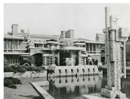
フランク・ロイド・ライト 《帝国ホテル(正面中央部入口)》 1923年 東京

「伝統」は見出されるものだとしたら、国外から発見された日本の姿も、いま、あらためて考察すべき知の資産です。来日したフランク・ロイド・ライトやアントニン・レーモンドから、現在第一線で活躍する作家まで、国外の作家が創造的に捉えた日本像を紹介します。展示資料に感じられる極東の島国への熱いまなざしが、未来の日本像を後押しします。