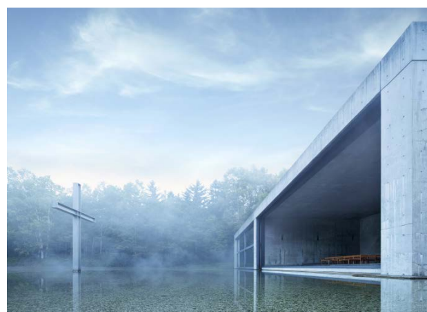
安藤忠雄 《水の教会(星野リゾート トマム)》 1988年 北海道