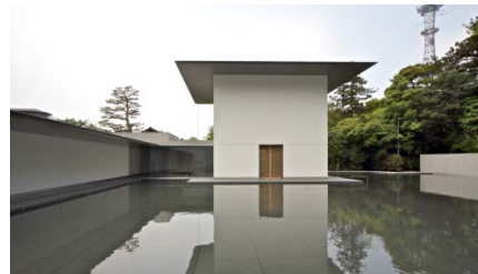
谷口建築設計研究所 《鈴木大拙館》 2011年 金沢

もののあはれ、無常、陰翳礼讃など、日本の美意識には超越的な姿勢があります。信じがたいほどの精細さと大胆さが溶け合い、シンプルという言葉すら超えた表現は、日本の建築の中にも受け継がれる遺伝子のひとつです。現在、世界が注目する日本人建築家たちにも通底する超越的な美学に焦点を当てます。