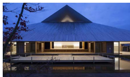
三分一博志建築設計事務所 《直島ホール》 2015年 香川

日本建築の遺伝子に屋根があります。覆われた形が自然環境を安定させ、人間のさまざまな行為を包み込み、機能的であることで変わらない安心感を象徴します。気候風土の中で洗練されたこの形が、近現代の建築家にいかなるインスピレーションを与えてきたか、屋根が内包する可能性に迫ります。