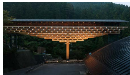
隈研吾建築都市設計事務所 《栲原・木橋ミュージアム》 2010年 高知

日本の気候風土が育んだ木の文化は、持続可能なシステムと言えます。伝統建築の壮観を伝える精巧な学術模型や大工の秘伝書、伝統的な木構造に触発された近現代の作品、本展覧会のために制作された最新プロジェクトなどを展示し、その未来を思考します。