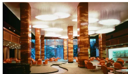
吉田五十八 《ロイヤルホテル(現リーガロイヤルホテル)メインラウンジ》 1973年 大阪

建築を工芸とみなしたらどのように捉えられるでしょうか。明治期に西洋から建築という概念が持ち込まれる以前の日本には、例えば日光東照宮の社殿の彫刻に顕著にみられるように、匠の技や意匠から継承されてきた「部分」の集積が「全体」即ち建築物をなす、高度に成熟したものづくりがありました。このような工芸性は遺伝子として近現代の建築にも脈々と流れています。