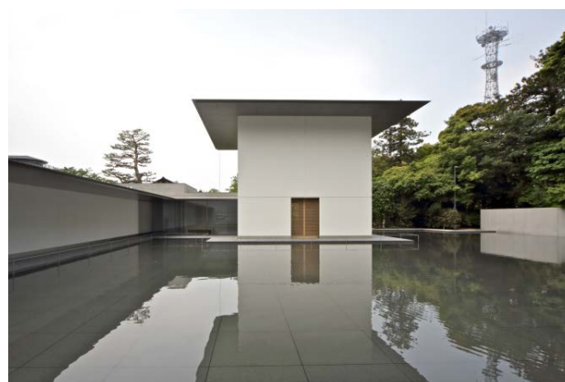
谷口建築設計研究所 《鈴木大拙館》 2011年 金沢