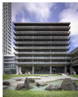
丹下都市建築設計 《香川県庁舎》 1959年 香川

厳密に空間を分け隔てなくても、建築が私たちの暮らしを豊かにすることを、日本の伝統は世界に示しました。厚い壁で内と外を区別したり、部屋の機能を固定化するのではなく、実用性が見た目の美しさにもつながる建築。近現代に発見され、現在も生き続ける開かれた空間の理想像を、それぞれの建築家の個性を引き出しながら展示します。