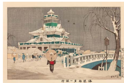
小林清親 《海運橋 第一銀行雪中》 平成の新版 大判錦絵 所蔵：清水建設

グローバルな世界の中で、自国の建築はどうあるべきなのか。西洋文明の外にありながら、世界で初めてこの問題に本格的に立ち向かったのが日本人でした。答えを求めて世界を一周した建築家・伊東忠太の模型をはじめとした貴重な資料群を通して、近現代における日本建築の冒険を紹介します。