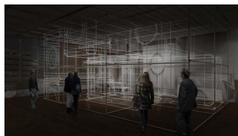
ライゾマティクス・アーキテクチャー 《Power of Scale》 2018年 インスタレーション ※参考図版

世界が注目するクリエイティブ集団、ライゾマティクスを率いる齋藤精一は、コロンビア大学建築学科で学び、建築で培ったロジカルな思考と知見をもとに創作するメディアアートで知られています。本展では「中銀カプセルタワー」ほか、日本の古建築から現代建築まで、名建築の数々をレーザーファイバーで再現。3次元の建築空間と映像が織り成す体験型インスタレーションを新作として発表します。