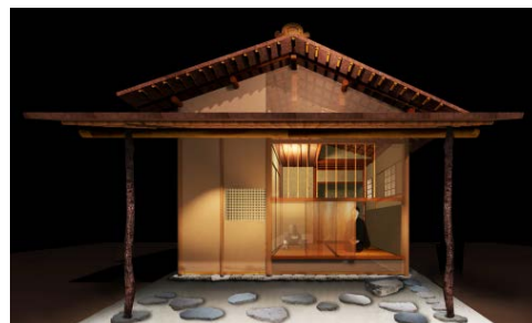
伝千利休 《国宝・待庵》 安土桃山時代(16世紀)/2018年(原寸再現) 制作:ものづくり大学 ※参考図版

千利休の作と伝えられ、京都・妙喜庵に現存する日本最古の茶室建築である国宝《待庵》は、「わび」の思想を空間化したもので、日本文化を語る上で欠くことのできない建築の一つです。本展では、原寸スケールで再現し、二畳の茶席やにじり口(出入口)で良く知られる極小空間を体感して頂けます。