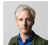
デイン・ミッチェル

1976年、ニュージーランド、オークランド市生まれ。2012年にオークランド工科大学にて哲学系修士号を取得。2009年から2010年は、ドイツ学術交流会(DAAD)の奨学金を受けてベルリン在住。シドニー・ビエンナーレ(2016年)、光州ビエンナーレ(2012年)、リバプール・ビエンナーレ(2012年)、シンガポール・ビエンナーレ(2011年)など数々の国際展に参加する傍ら、世界各地で個展を開催。オークランド在住。第58回ベネチア・ビエンナーレ(2019年)ニュージーランド代表。