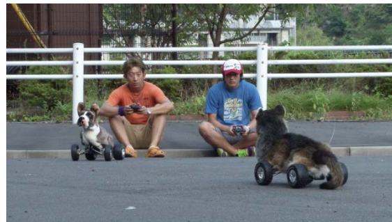
(左) 《過去と未来は、現在の中に》 2016年 HDビデオ 46分