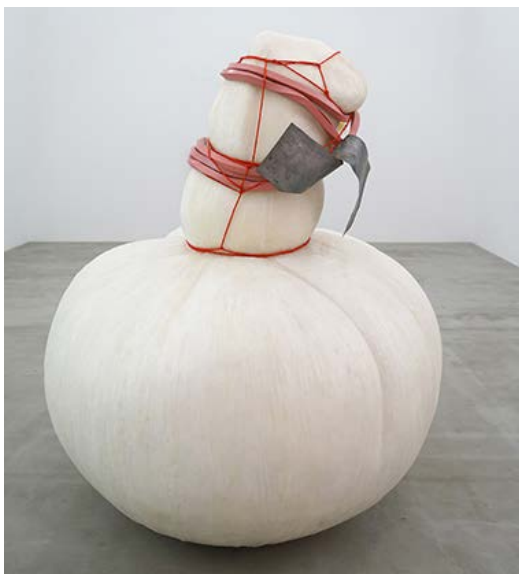
ハンディウィルマン・サブトラ 《根もなく、つぼみもないNo.12》 2011年 樹脂にアクリル、ポリウタレン塗料仕上げ、ガルバニ板、縫糸 150x150x150 cm

サブトラは、1998年のインドネシアにおける民主化の動きに呼応するような社会的、政治的な現代美術の潮流から距離をとり、作品がいかなるステートメントをも伝えるものではなく、ただそこに存在する物質であり、いかなる意義や目的にもとらわれないことを表明しています。本展にて展示する《根もなく、つぼみもないNo.12》は、ゴムで縛られた柔らかい袋状のものにも見え、巨大な植物の種子のように見えるかもしれません。しかしサブトラはそうした答えや意味を明示せず、観客ひとりひとりに感じ方やその解釈を委ねます。一方千葉は、自作の彫刻を含めた奇妙で不可思議な環境を実際にスタジオなどに構築し、それを絵画のモチーフとする手法で知られています。本展にて展示される《2013年のパワフルヤングボーイ》は、千葉が長年惹きつけられていた岩手県遠野市の「さすらい地蔵」を実際に訪ね、制作した作品です。当時のスケッチやメモ、絵画作品の詳細な計画を記したドローイングも初公開となります。