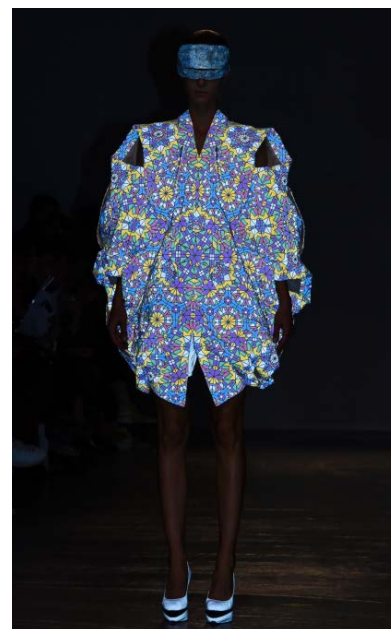
アンリアレイジ 《リフレクト》 2015年 綿