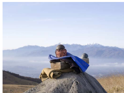
万代洋輔 《無題》(「蓋の穴」シリーズより) 2016年 Cプリント 84.8×105.5 cm

広報画像は下記の画像申請フォームより申請願います https://goo.gl/D6S82E