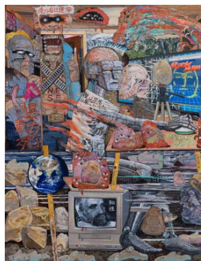
(左) 竹川宣彰 《猫オリンピック：開会式》(部分) 2017年 陶製人形、木、鉄、陶製タイル、ガラス製タイル 95×421.3×302cm 展示風景：「猫奥运：纪念虎二郎」オオタファインアーツ(上海)2017年 撮影：ボヨン・ドロン