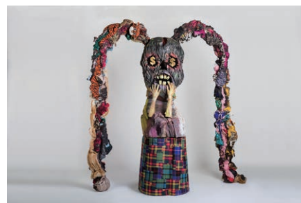
シオン 《誰もあんたの不幸に興味なんてないよ》 2018年 木製彫刻、ミクストメディア 196×180 cm ※参考図版