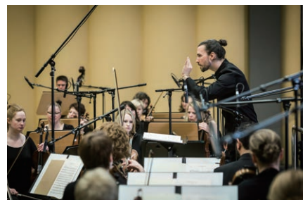
サムソン・ヤン(楊嘉輝) 《音を消した状態#22:音を消したチャイコフスキー交響曲第5番》2018年 ビデオ、12チャンネル・サウンド・インストール 45分

サムソン・ヤン(楊嘉輝)の映像と音を使ったインスタレーションを紹介합니다。オーケストラが交響曲を演奏する様子が映し出されるも、弦にテープを巻くなど、楽器が奏でる音が響かないように消音されています。かわりに、奏者の身体的な動作によって生み出されるガサガサという普段は聞くことができない音が響く別世界が広がります。これは、私たちが見聞きしているものの裏には別の真実があるかもしれない、ということを感じさせてくれるのです。