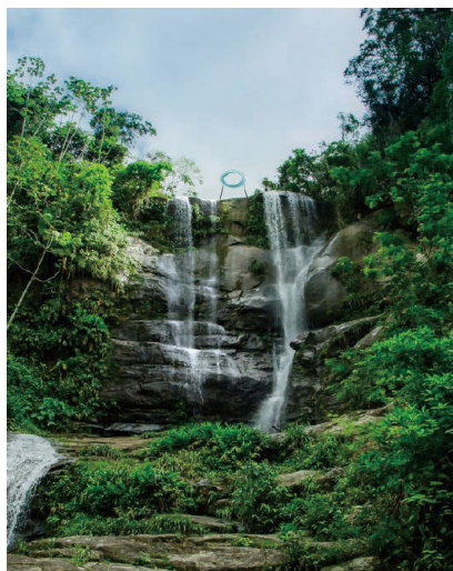
森万里子 《リング：自然とひとつに》 2016年 積層アクリル、ステンレススチール、コンクリート 618×φ300 cm Courtesy: Faou公益財団(ニューヨーク) 展示風景：クナンベベ州立公園(ブラジル、リオデジャネイロ州) 撮影：ステファニー・リアル