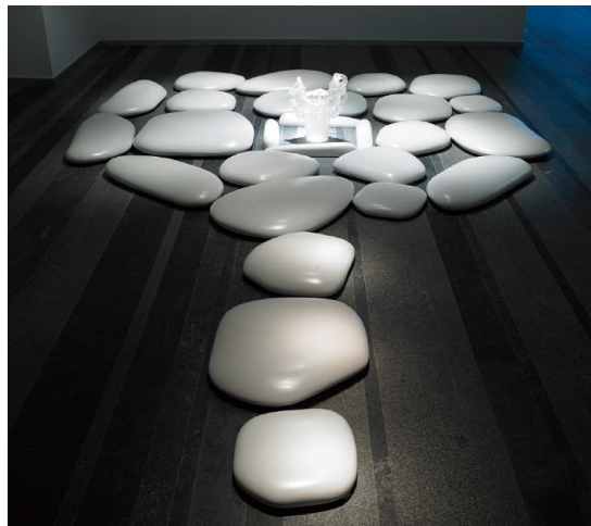
森万里子 《フラット・ストーン》 2006年 陶、アクリル 石：487.5×314.6×8.8 cm 壺：38.1×27.9×43.2 cm 所蔵：SCAI THE BATHHOUSE(東京) 展示風景：「ワンネス」ピンチュク・アートセンター(キウウ)2008年