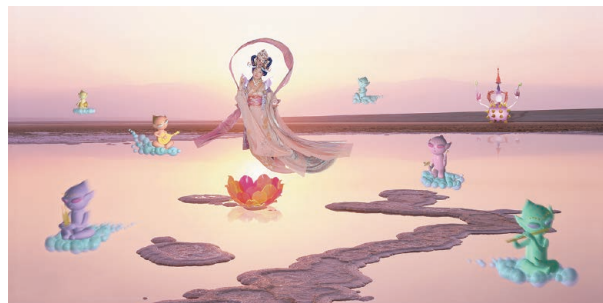
森 万里子 《エソテリック・コスモス：ピュア・ランド》 1996-1998年 写真、ガラス(インターレイヤー)、ステンレススチール 304.8×609.6×2.2cm