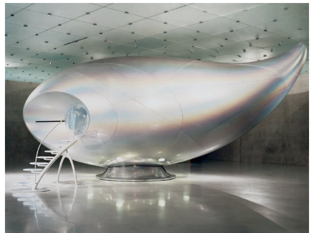
森万里子 《Wave UFO》 1999-2002年 脳波インターフェース、ビジョンドーム、プロジェクター、コンピュータシステム、グラスファイバー、テクノジェル、アクリル、カーボンファイバー、アルミニウム、マグネシウム 528×1134×493 cm 展示風景：「森万里子：Wave UFO」プレゲンツ美術館(オーストリア)2003年

プレスリリース お問い合わせ 「森万里子：燦燦」広報事務局(サニーサイドアップ内)