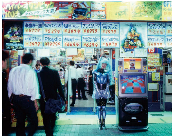
森 万里子 《プレイ・ウィズ・ミー》 1994年 フジ・スーパーグロスプリント、木、アルミニウム、ピューターフレーム 304.8×365.8×7.6cm