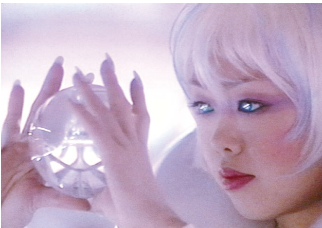
森万里子 《巫女の祈り》 1996年 ビデオ 4分42秒

森万里子は1990年代半ば、自身のパフォーマンスに基づいた写真や映像作品である「サイボーグ」シリーズを発表し、コンピューター・グラフィックスを先駆的に使ったSF的なイメージで時代の寵児として注目を浴びました。彼女の関心はその後、日本のアニメ文化やジェンダー、ポストヒューマンといった現代社会への批評的な視点から、仏教の死生観や宇宙観に深く影響された、より壮大な哲学的関心へと拡がり、涅槃や浄土など仏教的世界を連想させるインタラクティブな大規模インスタレーションへ発展します。21世紀に入り、世界各地で分断が広がるなか、太古の時間から無限の宇宙まで、時空を超越したあらゆる生命の繋がりを提唱する概念「ワンネス(Oneness)」が彼女の実践における中核的な価値観となっていきます。そこでは世界中の学者や科学者との研究・協力に基づき、アニミズム、縄文やケルトなどの古代文化、仏教の唯識論から、素粒子論、宇宙物理学まで、広範な主題の探究がなされ、《Wave UFO》(1999-2002年)に代表される、最新テクノロジーを駆使した作品として具現化、体験化されてきました。2010年には自然界と人間の繋がりを再認識する作品の恒久設置を目指してFaou(ファウ)公益財団を設立し、宮古島、リオデジャネイロなどでそのミッションが