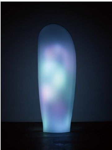
森万里子 《トムナフーリ》 2006年 ガラス、ステンレス、LED、リアルタイム制御システム 327.4×115.3×39.6 cm

2004年以降、森は新石器時代のケルト文化や縄文文化の世界観にインスピレーションを得たプロジェクトを展開するようになります。ケルト文化において先祖の霊魂が転生する場を意味する《トムナフーリ》(2006年)は、東京大学宇宙線研究所のニュートリノ観測施設「スーパーカミオカンデ」からのリアルタイム・データによって発光する、トーテム状の立体作品です。太陽や地球の大気、遠方の超新星から発生するニュートリノに反応し、目に見えない宇宙の出来事を光の明滅へと変換することで、人智を超えた自然現象と鑑賞者を結びつけます。また、沖縄県の久高島、秋田県にある縄文時代のストーンサークル、大湯環状列石の写真作品や、縄文中期から後期の敷石住居などのリサーチから生まれた《フラット・ストーン》(2006年)も展示されます。昨年ニューヨークで発表されたインスタレーション《お社》 やしろ も展示され、内部に置かれた立体は日本神話に登場するオノコロ島の上立神岩や、熊本県の押戸石などをモチーフにしています。