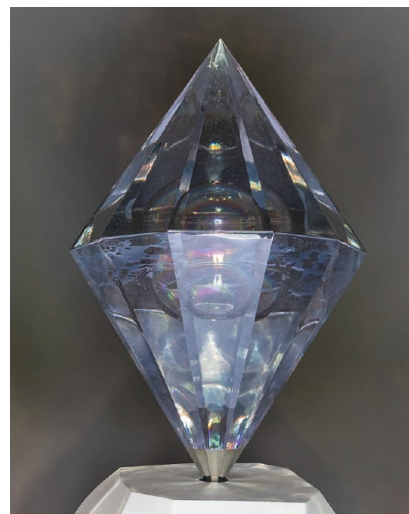
森万里子 《ピース・クリスタル》 2016-2024年 クリスタル・ガラス、ステンレススチール 167.3×φ100.7 cm 展示風景：パラッツォ・コルネル・デッラ・カ・グランダ(イタリア、ベネチア)2024年