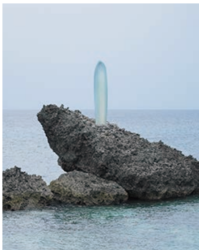
森万里子 《プライマル・リズム：サンピラー》 2011年 積層アクリル、ステンレススチール、コンクリート 420×φ76 cm 展示風景：宮古島七光湾(沖縄)

展示の締めくくりとして、森が2010年に設立したFaou公益財団の活動を紹介します。「Faou」は「創造する力」を意味する造語で、同財団の活動は世界6大陸において、それぞれの地域コミュニティの協力を得ながら、宇宙や天空の動きとも連動したパブリックアート作品を設置しています。そして、その目的は自然環境という地球の宝の中で、自然と人間の関係への意識を高めようとするものです。2011年には宮古島に《プライマル・リズム：サンピラー》が、2016年にはリオデジャネイロに《リング：自然とひとつに》が恒久設置されました。また、エチオピアでの設置が計画されている《ピース・クリスタル》が、2024年にベネチアで発表されています。本展では、森が宮古島に建てたアトリエ「ユプティラ」（宮古言葉で豊かさを表すユプと太陽を表すティダを融合した名前）から見える海の風景、《プライマル・リズム：サンピラー》、《リング：自然とひとつに》など、美術館空間に収まらない活動をまとめた新作映像を大型LEDディスプレイで展示します。